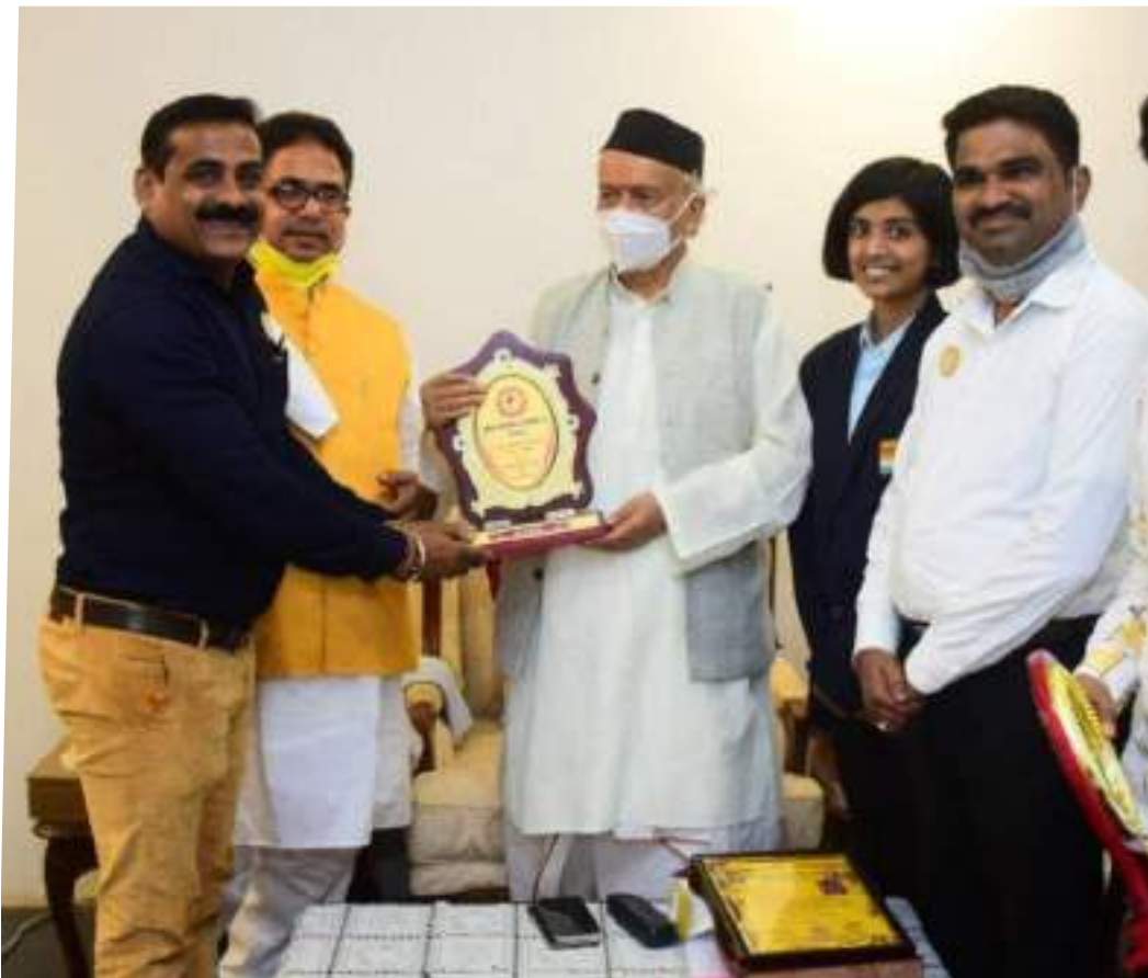
Pupils Olympic Association Goodwill meeting with His Excellency Governor of Maharashtra State Bhagat Singh Koshiyari !