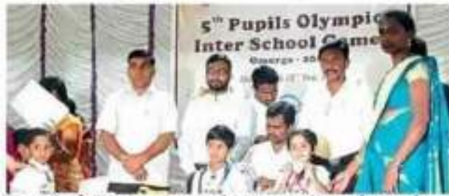
किल्लारी : येथील डी. वाय. सनराईज स्कूलच्या विद्यार्थ्यांना सुवर्णपदक देऊन सन्मान करताना स्पर्धेचे आयोजक.