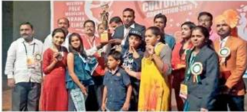
जालना : राष्ट्रीय नृत्य स्पर्धेत जालन्यातील सहा विद्यार्थ्यांनी यश मिळविले.